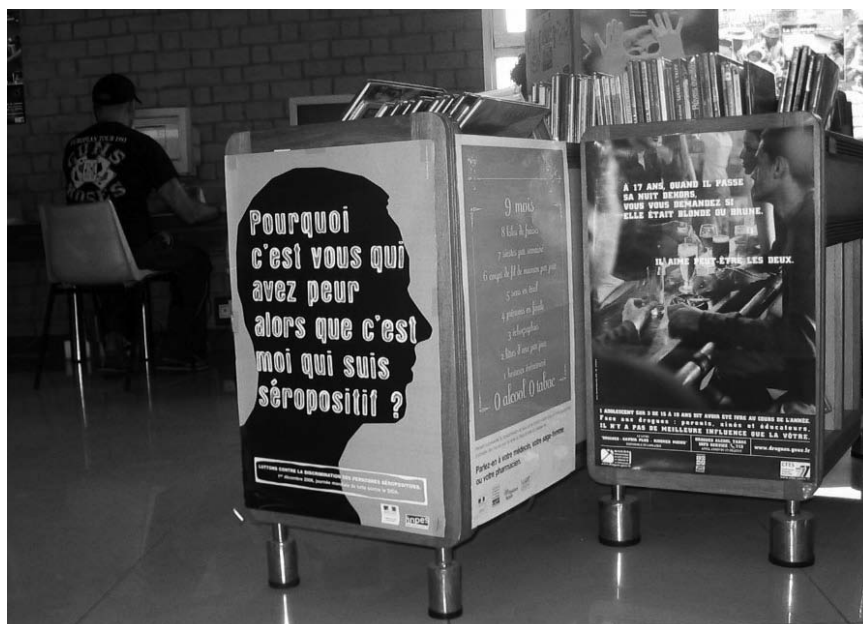
Bibliothèque de l'Alliance franco-malgache, Antananarivo.

En Amérique du Nord, les campagnes de lecture d'été sont une pratique très courante. Elles sont organisées par les bibliothèques pour toutes les tranches d'âge y compris les jeunes, toujours appuyées par des sites web où l'on peut poster des commentaires sur les livres. L'idée est d'aider les jeunes qui n'ont pas l'habitude de lire à maintenir les acquis lecture pendant les grandes vacances.