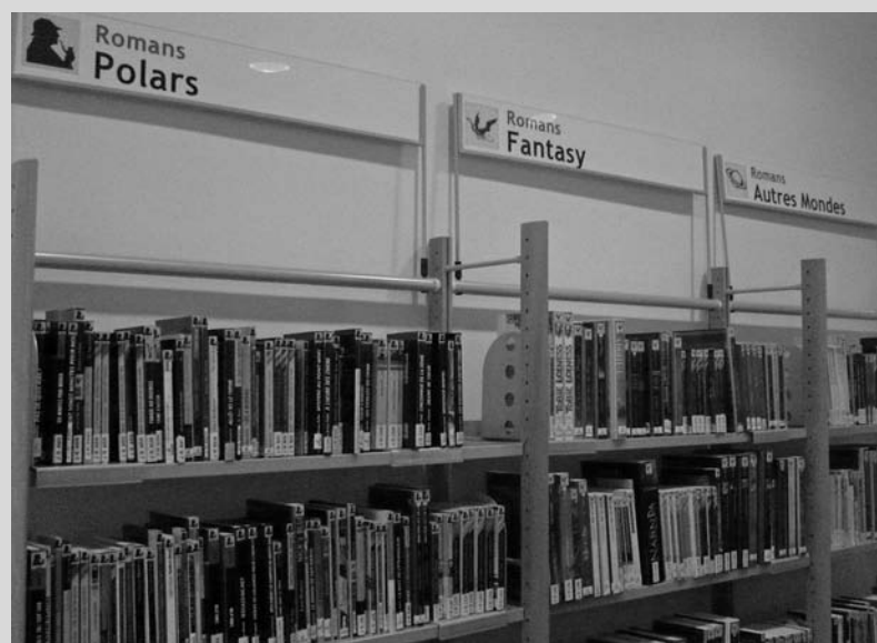
Bibliothèque Chaptal, Paris.

Soizik Jouin, « Où sont les romans qui racontent des problèmes ? Classer autrement les romans pour les jeunes afin de mieux répondre à leurs besoins et les inciter à lire » in www.ifla.org/IV/ifla74/satellite-7/Présentation_Jouin.pdf