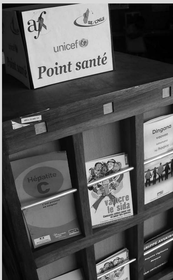
Bibliothèque de l'Alliance franco-malgache, Antananarivo

Et, évidemment, les études. Les jeunes utilisent la bibliothèque en grande partie pour trouver l'information pour les devoirs. L'aide du bibliothécaire est alors très importante. Lors de rencontres organisées au Danemark afin de récolter les avis des jeunes 4 une forte demande d'aide qualifiée pour faire les devoirs s'est manifestée, y compris pour faire des recherches sur Internet : ce n'est pas parce qu'ils surfent sur Internet qu'ils savent chercher l'information... On constate, dans différents pays du monde, une volonté de développer des programmes d'aide aux élèves en difficulté et de fournir des outils pour les aider dans leur scolarité.