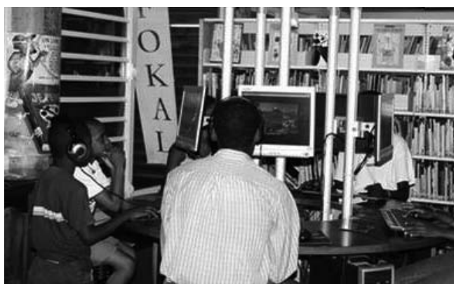
Bibliothèque Monique Calixte, Port-au-Prince

Texte complet in www.lajoieparleslivres.com dans la rubrique Bibliothèque numérique / Outils documentaires / Pour prolonger la lecture de Takam Tikou 15.