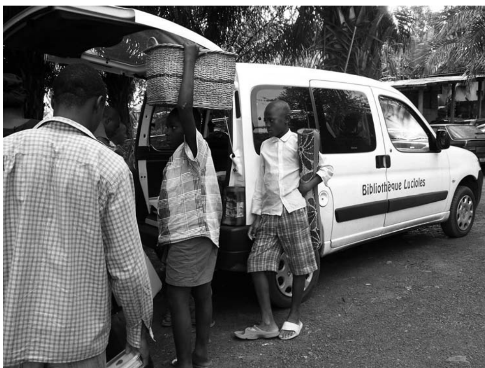
Départ de la camionnette de la bibliothèque Lucioles, Yaoundé.