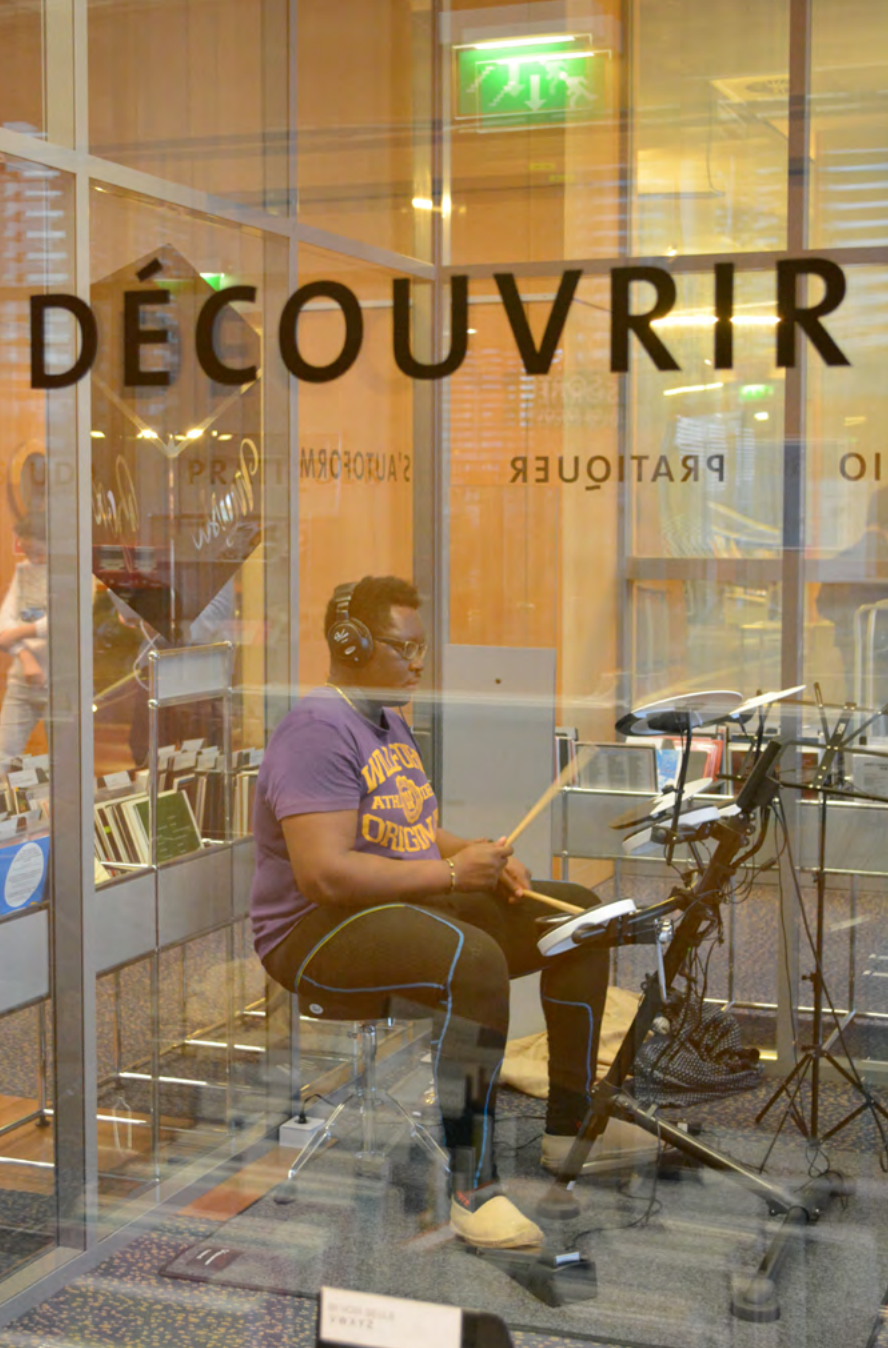
Médiathèque J. Cabanis – Toulouse