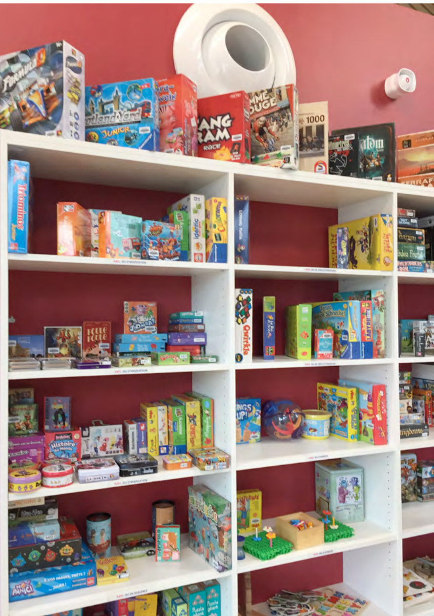
Médiathèque – ludothèque Les Granges – St Jean

La Ville de Paris organise ses propres concours pour recruter ses personnels de bibliothèque de catégorie C et B. Pour les concours de catégorie A, elle propose chaque année des postes aux concours d'État de conservateur des bibliothèques et de bibliothécaire. Elle peut recruter par voie de détachement des fonctionnaires territoriaux et d'État.