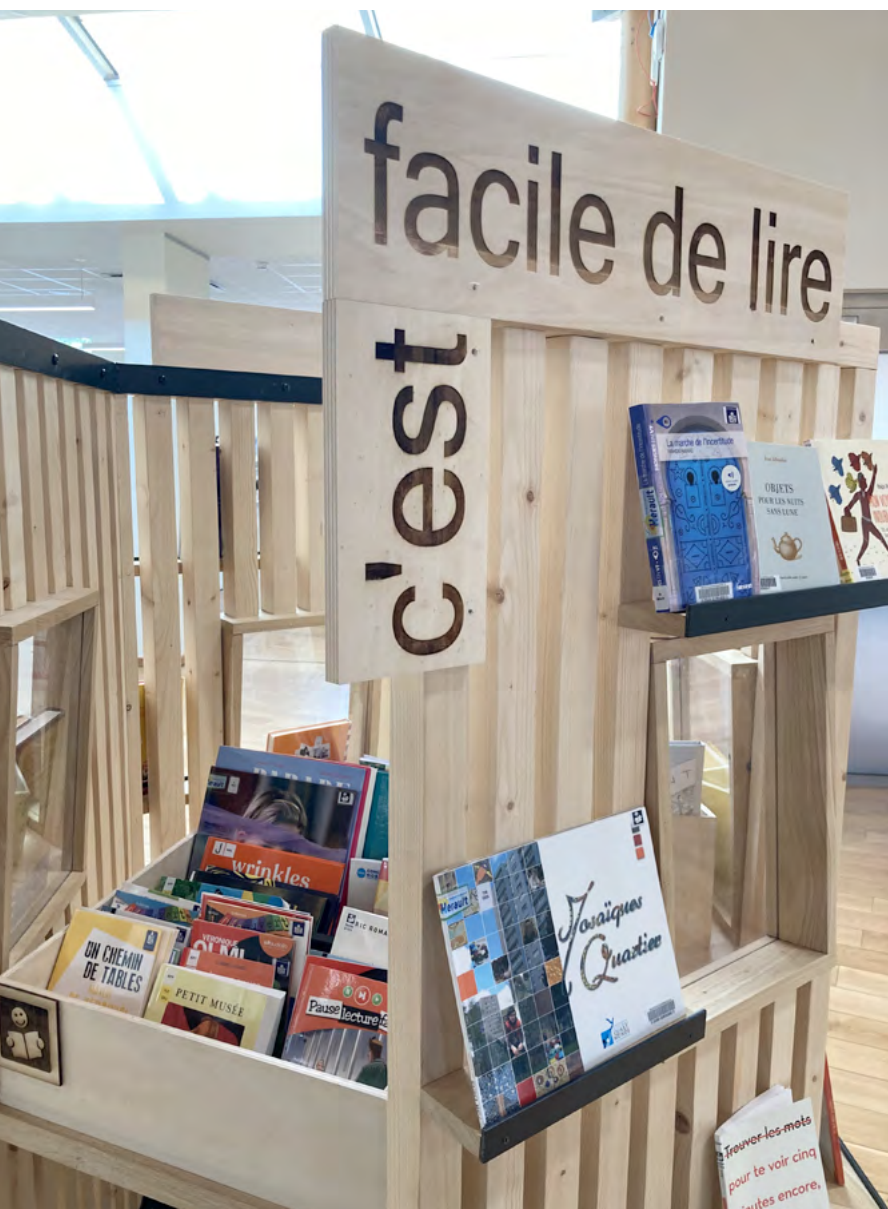
Médiathèque Confluence – Lodève

Une responsable d'un centre de conservation et de restauration en bibliothèque municipale