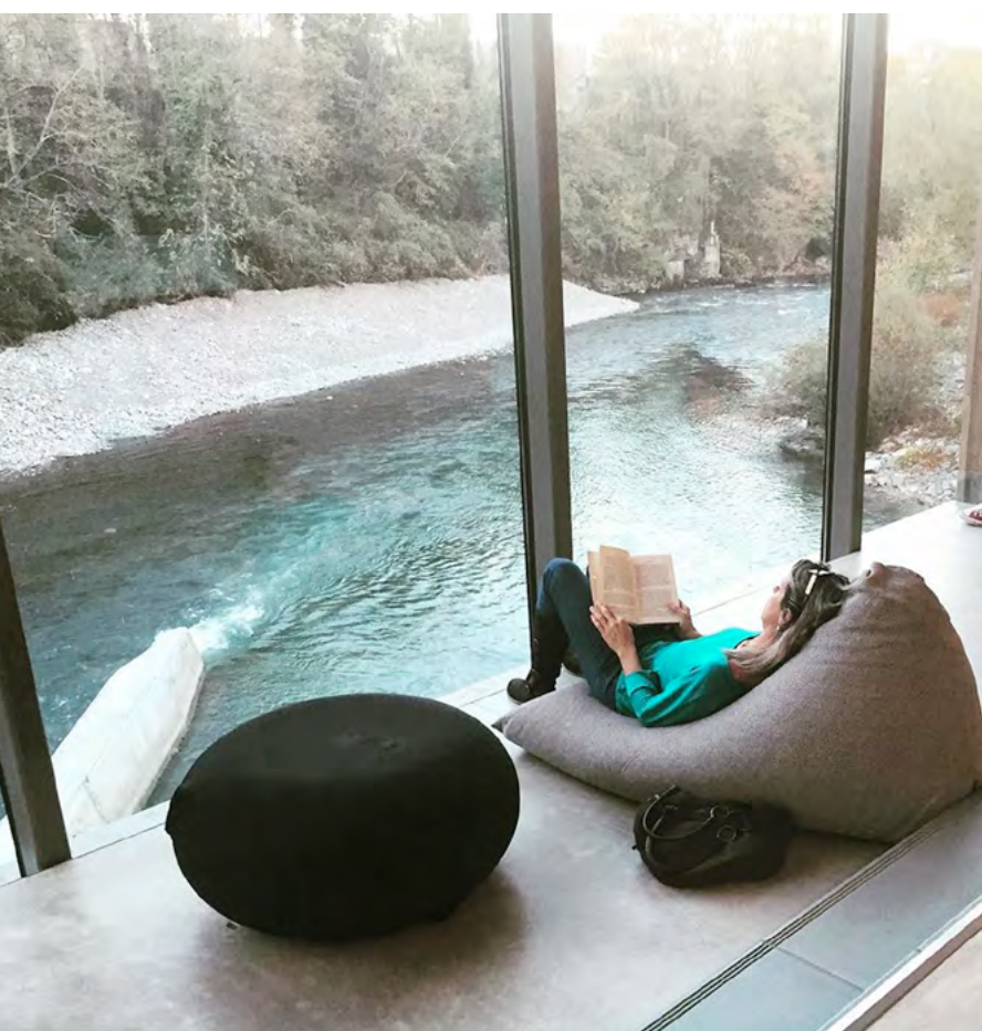
Médiathèque des Gaves – Oloron-Sainte-Marie

Ce sont des lieux vivants, riches d'expériences humaines, stimulants pour la connaissance et les imaginaires, inclusifs, grands ouverts sur la diversité des personnes et des savoirs, bouillonnants d'initiatives et d'expérimentations, sensibles aux enjeux de société. Ils offrent des métiers passionnants et utiles, au sein desquels on apprend beaucoup et où l'on peut évoluer sur une très grande diversité de missions.