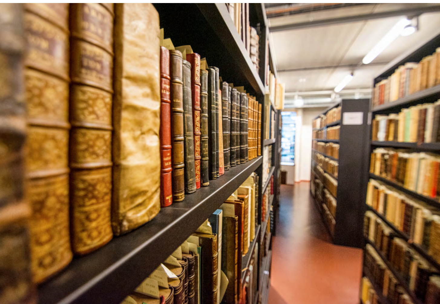
Médiathèque F. Mitterrand - Les Capucins - Brest